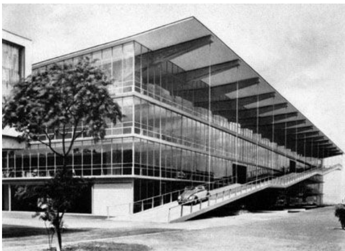
Haniel Multi-Storey Car Park. Dusseldorf 1951. Wolswagen Car Towers en Wolfsburg y Smart Tower en Saarbrucken