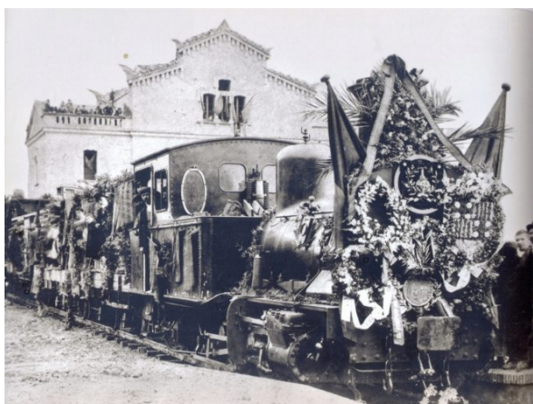
Inauguración de la Línea del Llobregat de los Ferrocarriles Generalitat Catalunya 1919.