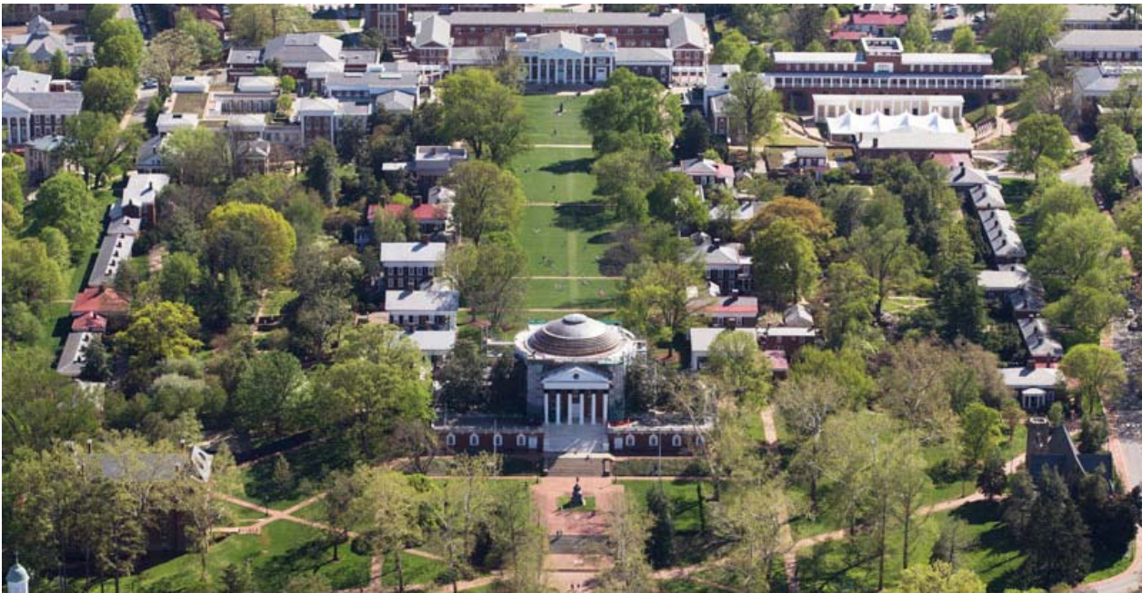
Campus Universidad Virginia. Thomas Jefferson 1818.