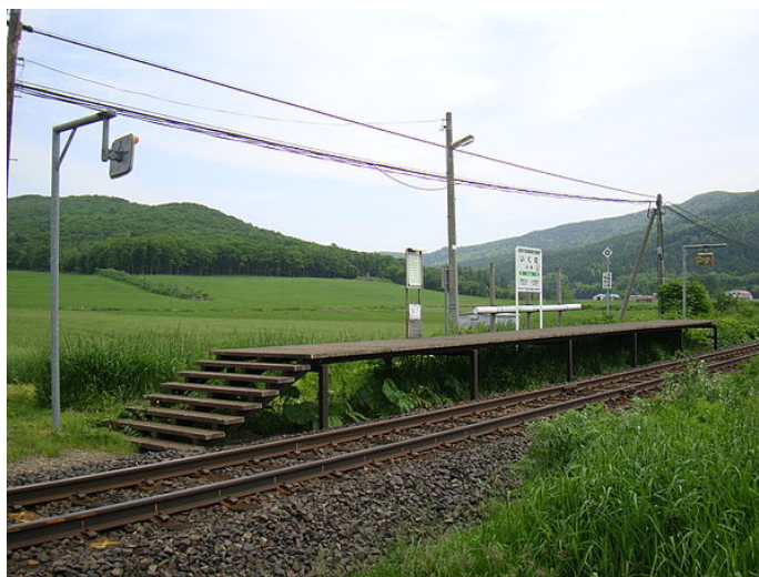
Estación de ferrocarril en Ikuno. Japón. 2019

El curso que aquí se presenta, corresponde a los dos cuatrimestres que constituyen el cuarto año de los estudios del Grado de Arquitectura. Su situación pues rebasa el ecuador de esta etapa académica, lo que posibilita, con más razón que en cursos anteriores, abordar el “proyecto arquitectónico” como el crisol de los conocimientos adquiridos en los tres primeros años de carrera. El alumno, después de haber “aprendido” los mecanismos de proyecto y el instrumental tecnológico básico, se encuentra preparado para “aprehender”, es decir, destilar los conocimientos genéricos adquiridos en forma arquitectónica.