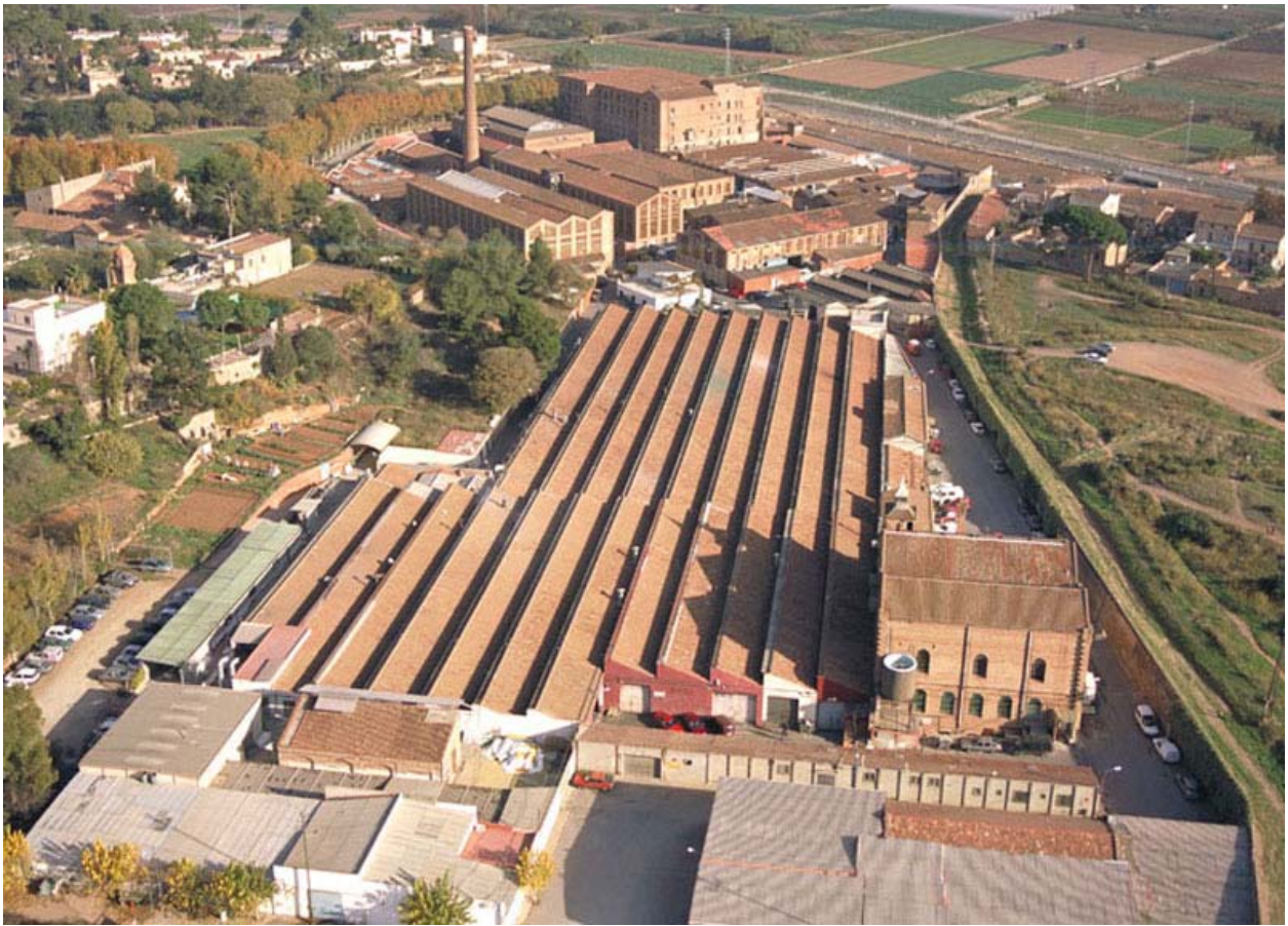
Recinto Industrial de la Colonia Güell. Vista desde el linde posterior a su acceso.

Durante el Cuatrimestre de Primavera el objeto de estudio será el Recinto Industrial de la Colonia Güell situado en la franja que definen los municipios de Santa Coloma de Cervelló y Ciudad Cooperativa, un ámbito territorial conocido por el alumnado al estar incluido en el territorio ya trabajado en el cuatrimestre anterior.