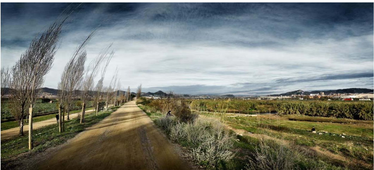
Referencia trabajo: Parque Fluvial y Agrario del Río Llobregat. Arquitectos: Roig y Batlle.

Con estas propuestas se intentará aprovechar el carácter nodal de estas estaciones introduciendo nuevos espacios de trabajo en ámbitos suburbanos que otorguen un carácter ambivalente al recorrido del tren, ya que de igual manera que los residentes en el valle del Llobregat se desplazan a Barcelona a trabajar, ciudadanos de Barcelona lo puedan hacer en sentido contrario buscando un lugar de trabajo en entornos de mas calidad medioambiental gracias a la reciente recuperación ecológica del cauce del río Llobregat a partir del Proyecto del Parque Fluvial y Agrario. Esta nueva oferta de “espacios para el trabajo”, responde a los “nuevos paisajes productivos” defendidos desde una nueva conciencia ambiental. Las grandes marcas, cambian hoy en día sus emplazamientos y centros de producción ligados a la imagen de “industria sucia” por implacables edificios emplazados en entornos naturales con los que pretenden vender su compromiso ecológico. Atendiendo a esta realidad, es necesario también ofrecer al incipiente empresario o profesional un mercado inmobiliario similar, algo que se pretende abordar en este ejercicio concreto.