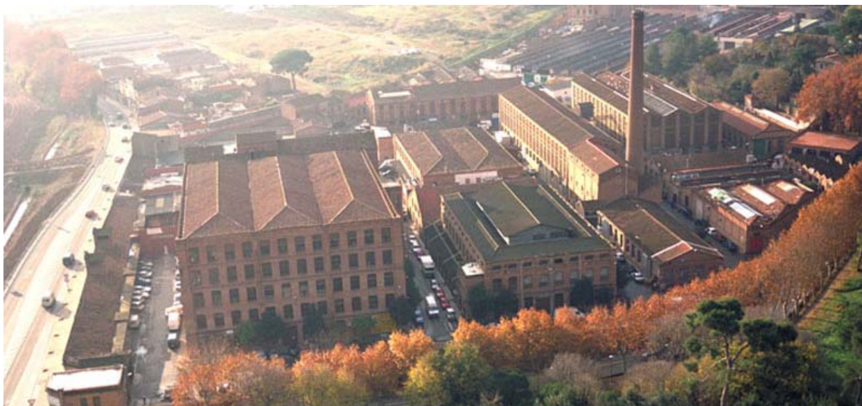
Recinto Industrial de la Colonia Güell. Vista desde el linde con la Colonia Güell.

Una vez abordada la escala grande relativa al “recinto”, cada alumno elegirá la pieza arquitectónica que desarrollará como Proyecto Básico y Proyecto de Ejecución. En esta parte del ejercicio, además de definir las “estrategias de consolidación de lo existente” y lo que constituye “la intervención en lo construido”, se definirá, con la escala adecuada a cada caso, el espacio libre de edificación adyacente a la pieza arquitectónica resultante.