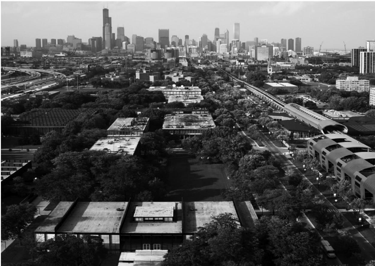
Campus Illinois Institut of Technology. Mies van der Rohe 1949-52