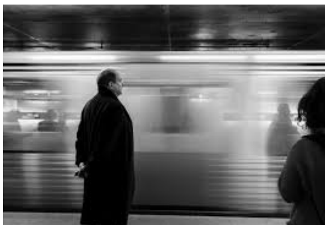
Nodalidad Metropolitana Ferrocarriles Generalitat Catalunya 2019.

Como se ha explicado con anterioridad, el proyecto consistirá en una arquitectura que deberá contener dos usos distintos: el de aparcamiento y el de lugar de trabajo. El Área Metropolitana de Barcelona acoge a una población que usa de forma intensa las infraestructuras de transporte que la estructuran. Si generalmente el sentido del transporte en horas punta conduce a la población suburbana a la capital, el ejercicio pretenderá igualar el tráfico en el sentido contrario como una forma de aprovechar los recorridos inversos, pero sobre todo, en un intento de repartir la actividad económica, equilibrando el territorio.