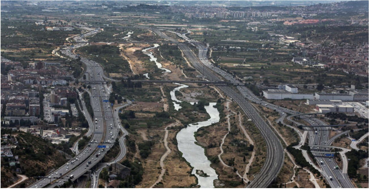
Estado Actual de Área.

El programa funcional a resolver recogerá las necesidades de aparcamiento globales del territorio de estudio, lo que requerirá abordar el trabajo a dos escalas diferentes: la urbanística , definiendo las volumetrías y sus respectivos emplazamientos en cada una de las cuatro estaciones de estudio, en definitiva, “construyendo el lugar” y la arquitectónica , desarrollando los documentos relativos al Proyecto Básico y al Proyecto de Ejecución del edificio vinculado a una de ellas. Se trata por lo tanto de un ejercicio en el que en el enunciado del proyecto a resolver definirá un programa funcional para un territorio acotado, por lo que el alumno deberá elegir y construir el lugar que acogerá a la arquitectura de nueva planta propuesta en un intento de aunar arquitectura y paisaje.